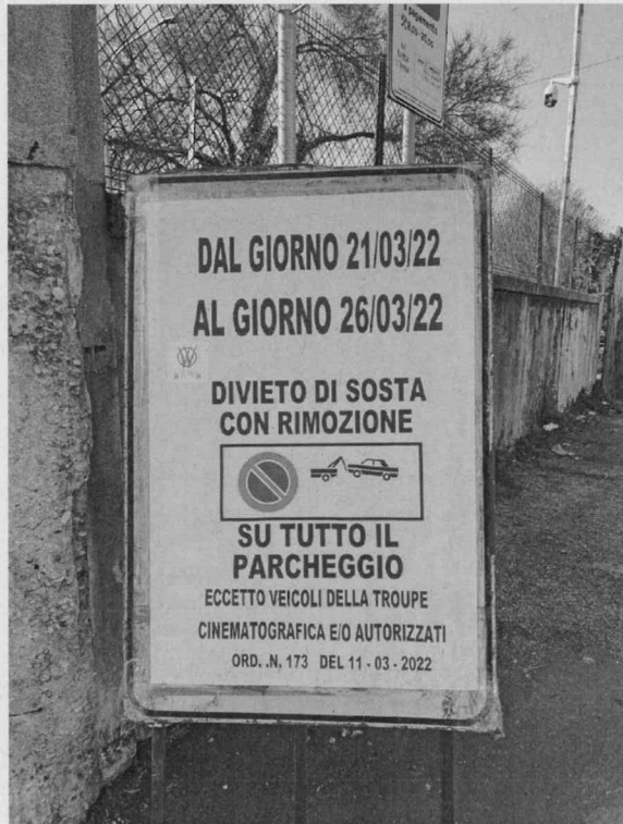
Parcheggio via Torino