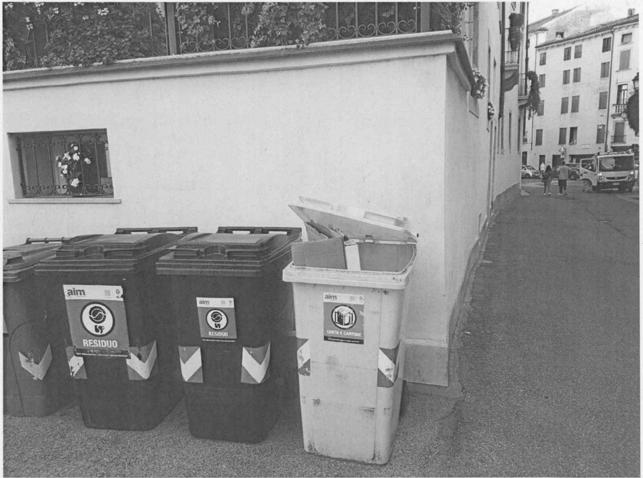
Posizionamento della preesistente segnaletica