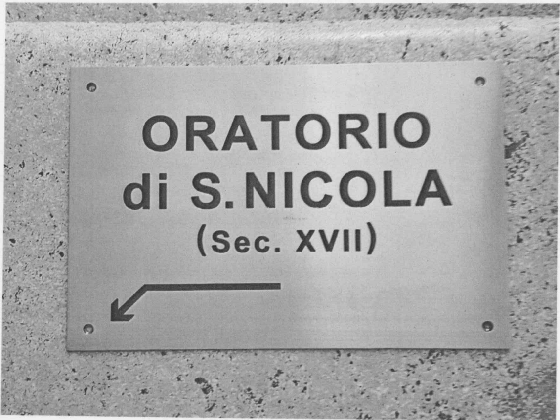
Fac-simile della preesistente segnaletica