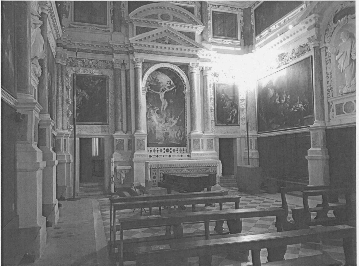
Vista d'interno dell'Oratorio di San Nicola