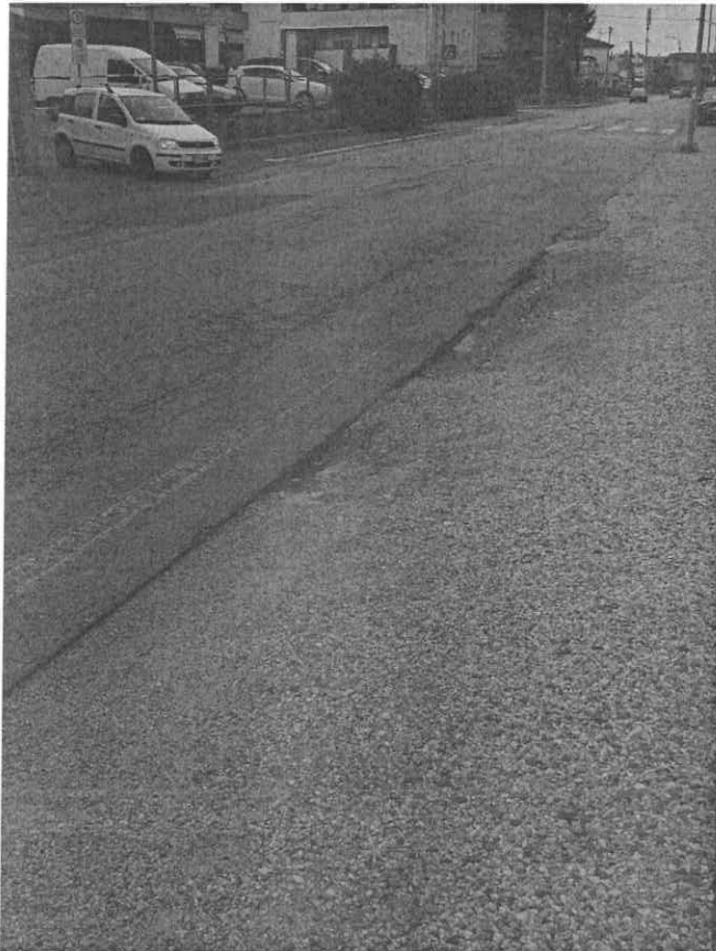
FOTO n. 03 - Buche in via Ca' Balbi civ. 98-100