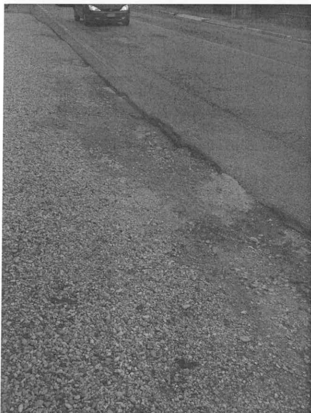
FOTO n. 04 - Buche via Ca' Balbi civ. 98-100