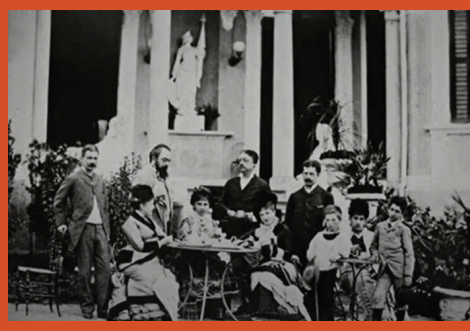
RECOARO TERME, CON LA REGINA MARGHERITA ALLA SCOPERTA DELLE FONTI TERMALI