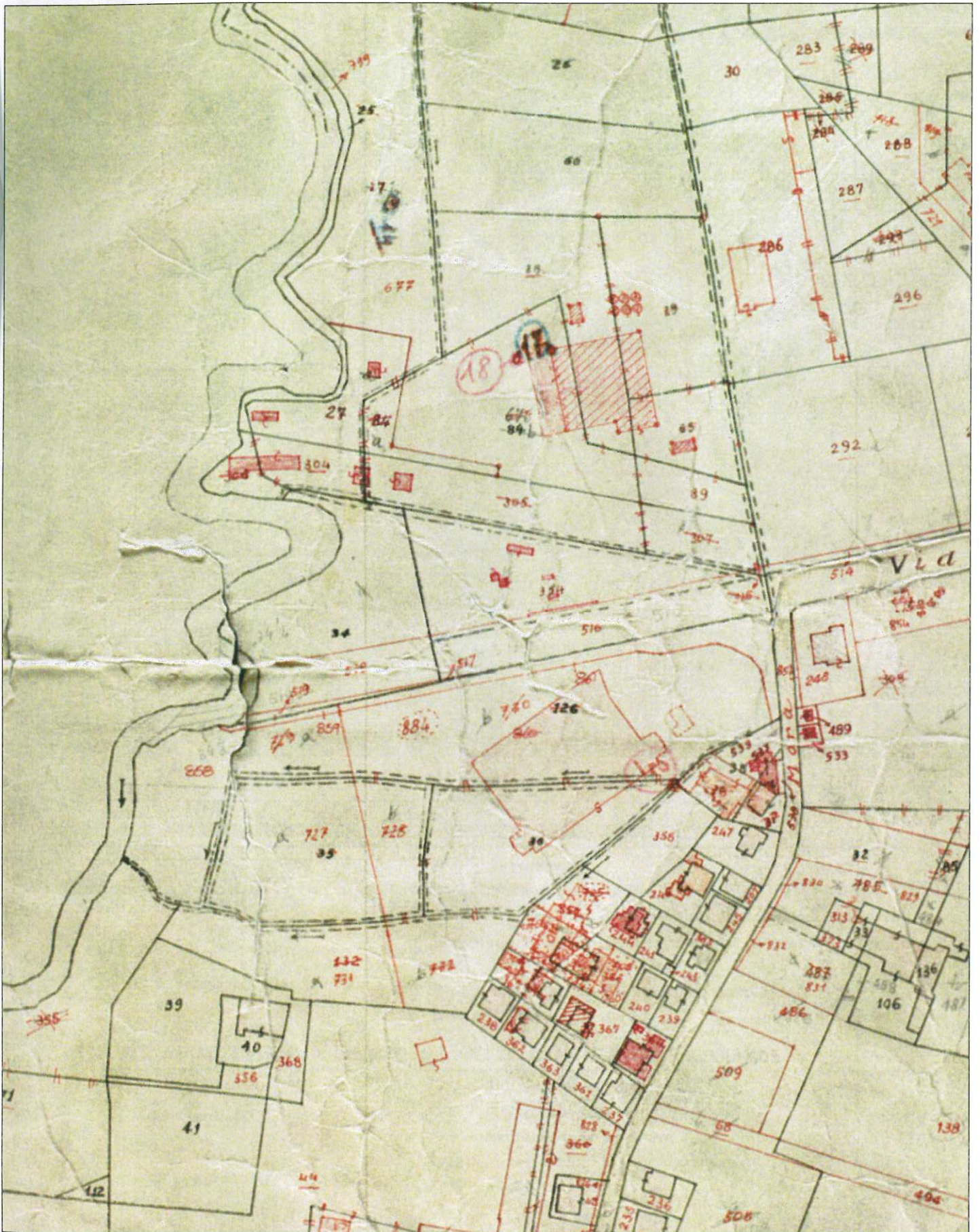
Planimetria Catastale 1:2000 Comune di Vicenza Fg. 77 Mapp. 34-354