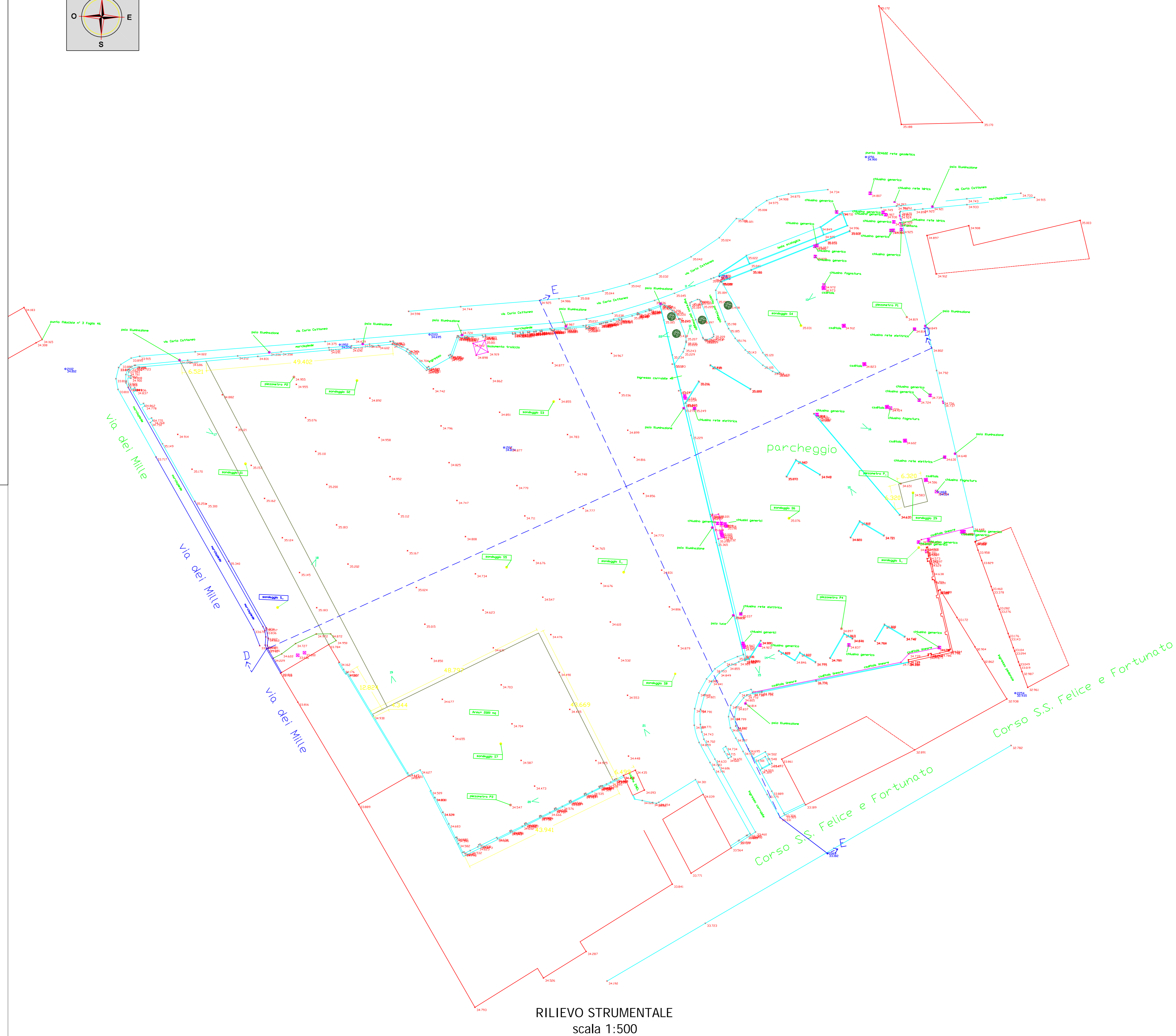
RILIEVO STRUMENTALE scala 1:500